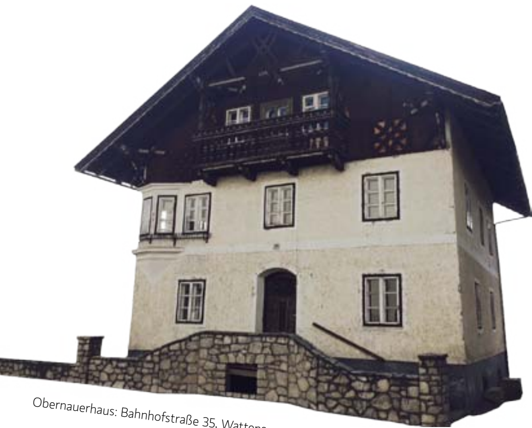
Obernauerhaus: Bahnhofstraße 35, Wattens